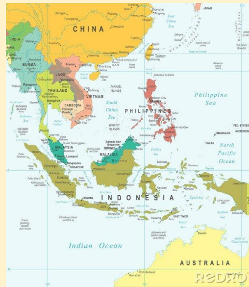
Asien und Ozeanien