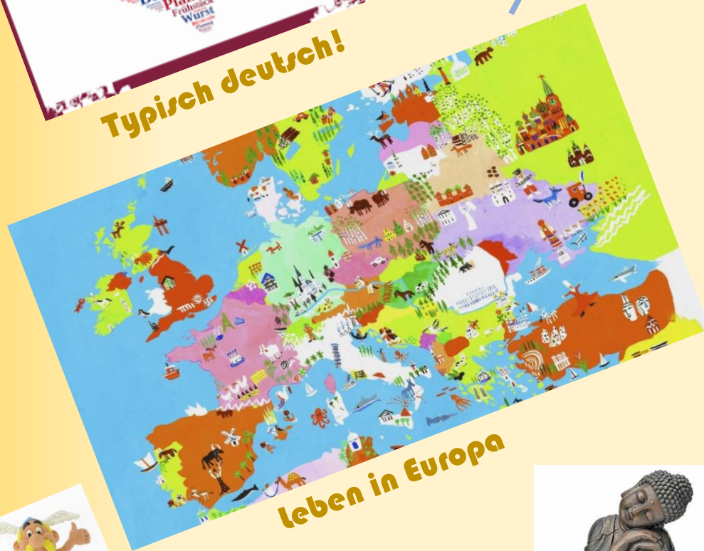
Leben in Europa