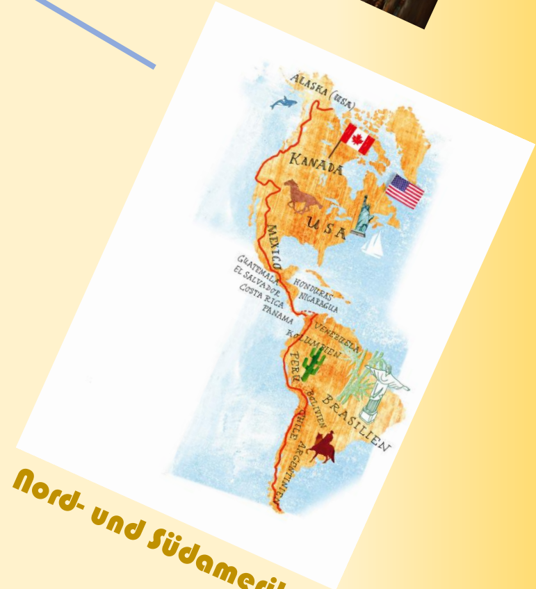
Nord- und Südamerika